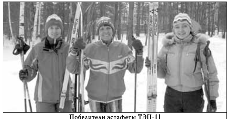
Победители эстафеты ТЭЦ-11

На будущее хочу пожелать всем, чтобы на следующей спартакиаде спортсмены боролись за победу с не меньшим патриотизмом и гордостью за свою фирму.